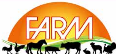
VENDITA AL DETTAGLIO DI CARNI, SALUMI E FORMAGGI