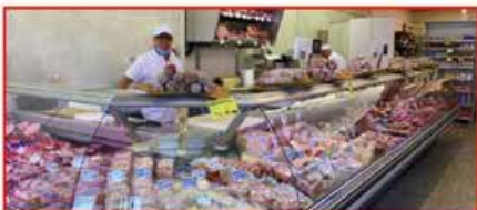
MARCALLO con CASONE via Gornati, 12 Tel. 02.9760450